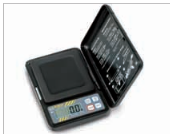
KERN TEB · CM · CM-C