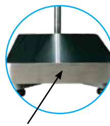
Plateau de pesée en inox 304