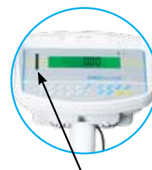
Voyants LED pour le contrôle de pesée