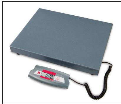
Les modèles de 75 kg et 200 kg sont disponibles avec une grande plate-forme