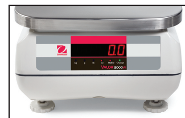
Valor 2000 avec affichage LED arrière