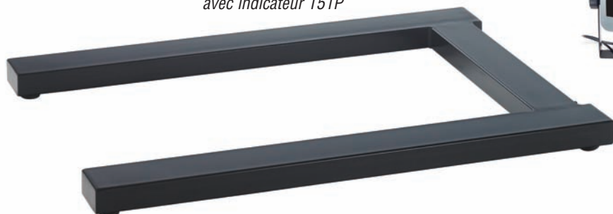
Modèle en acier peint avec indicateur T51P